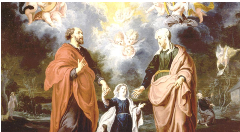
Sveta Ana i Joakim – roditelji Blažene Djevice Marije