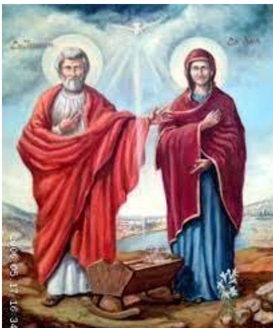
Sveti Joakim i Ana – roditelji BDM

e-mail adrese župe: zupa.semeljci@gmail.com